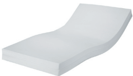
Rhomb-Care® Semy Hygienebezug weiß