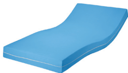
Rhomb-Care® Prima Feinjerseybezug hellblau

Unsere Rhombo-Care® Therm Matratzen sind variabel mit 4 verschiedenen Matratzenbezügen lieferbar. Die Materialien wurden mit Sorgfalt nach den speziellen Erfordernissen der Pflegepraxis ausgewählt.