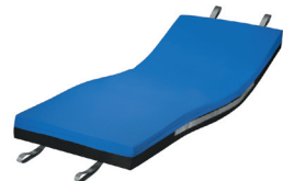
Rhomb-Care® Semy Plus EA Hygienebezug blau-schwarz