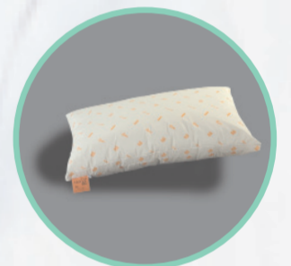
Rhomo-med® Lagerungskissen mit Seitenboden

Art.Nr. Größe 46.100 Ø 20 x 100 cm 46.200 Ø 20 x 220 cm Hilfsmittelnr. für 46.100: 11.11.05.1006 Hilfsmittelnr. für 46.200: 11.11.05.1005