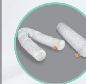
Rhomo-med® Rolle zur Positionsunterstützung

Art.Nr. Größe 46.100 Ø 20 x 100 cm 46.200 Ø 20 x 220 cm Hilfsmittelnr. für 46.100: 11.11.05.1006 Hilfsmittelnr. für 46.200: 11.11.05.1005