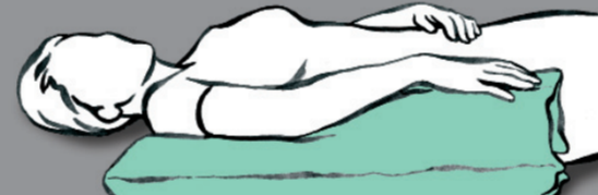
Arm hochlagern zur Oedemprophylaxe