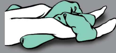
Wahrnehmungsförderung der diagonalen Muskelstränge