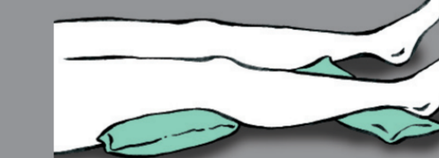
Minimale Verlagerung unter dem Bein