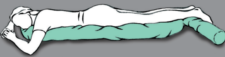
Wahrnehmungsförderung der Körpervorderseite