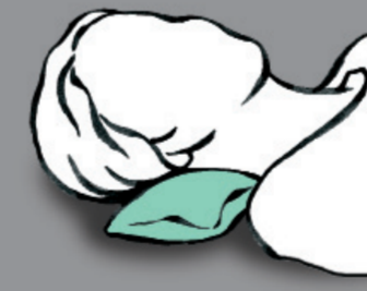
Minimale Verlagerung unter dem Kopf