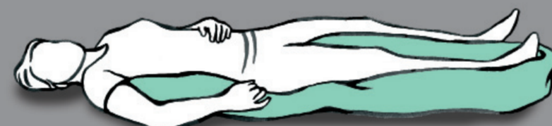
Wahrnehmungsförderung der rechten Körperhälfte