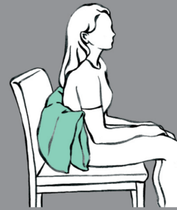
Stabilisiertes Sitzen - Schulterblatt frei