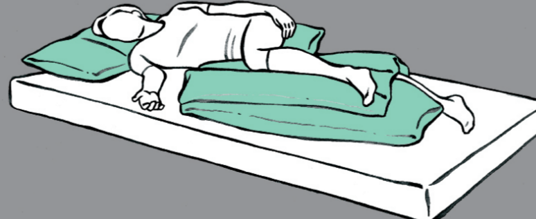
Liegen auf der betroffenen Seite