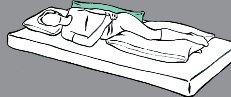
Minimale Verlagerung des Kissens im Rücken