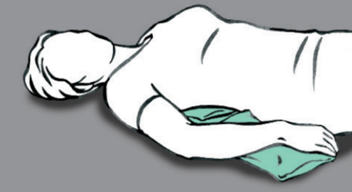
Minimale Verlagerung des Kissens unter dem Arm