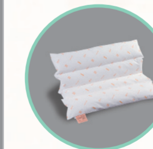
Rhomo-med® Multikissen (gekammertes Beinkissen)

Art.Nr. Größe 46.900 15 x 30 cm Hilfsmittelnr.: 11.11.05.1012