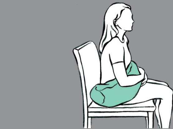
Schließen der offenen Seite

Art.Nr. Größe 32.805 25 x 80 cm Hilfsmittelnr.: 11.11.05.1009