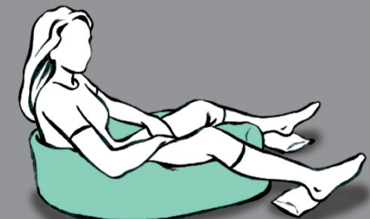
Blockierung der Zwischenräume