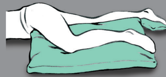
Unterstützung des betroffenen Beines als Ganzes