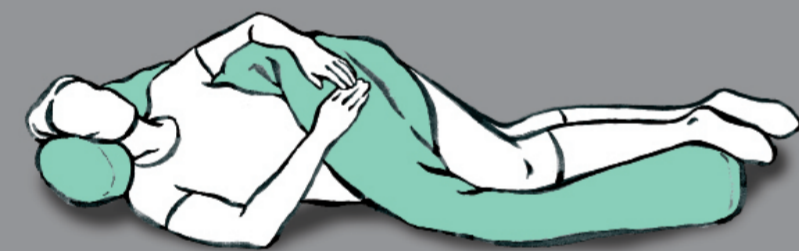
Unterstützung der diagonalen Muskelstränge