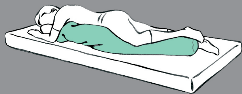
Wahrnehmungsförderung der Körpervorderseite